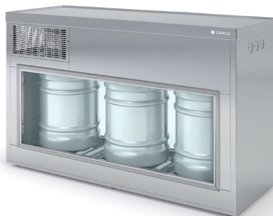
EBV-150 Respaldo de cristal Double glazed rear side