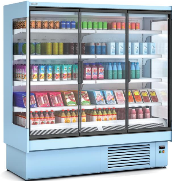
CDG1 18 M1-M2

VITRINA EXPOSITORA MURAL GAMA CEDAR FONDO 1 (797MM)/ MULTIDECK DISPLAY CEDAR RANGE DEPTH 1 (797MM)