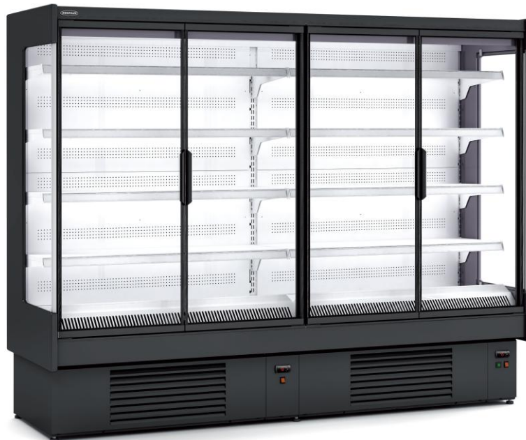
CDG3 25 M1-M2

VITRINA EXPOSITORA MURAL GAMA CEDAR FONDO 3 (897MM)/ MULTIDECK DISPLAY CEDAR RANGE DEPTH 3 (897MM)