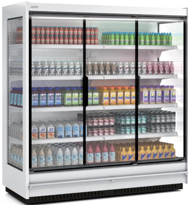
CRMG20033 18 M1-M2