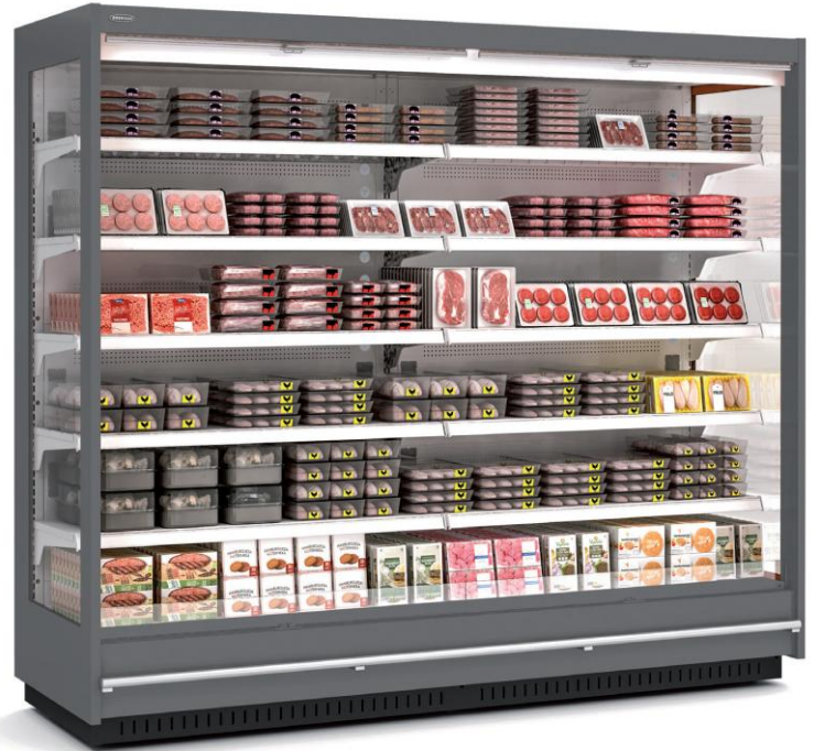
CRMS20033 25 M1