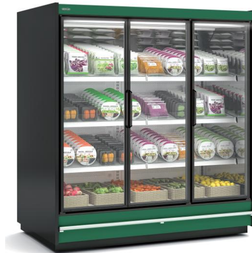
CRMG20133 18 H1