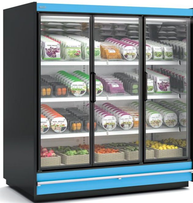
CRMG20433 18 H1