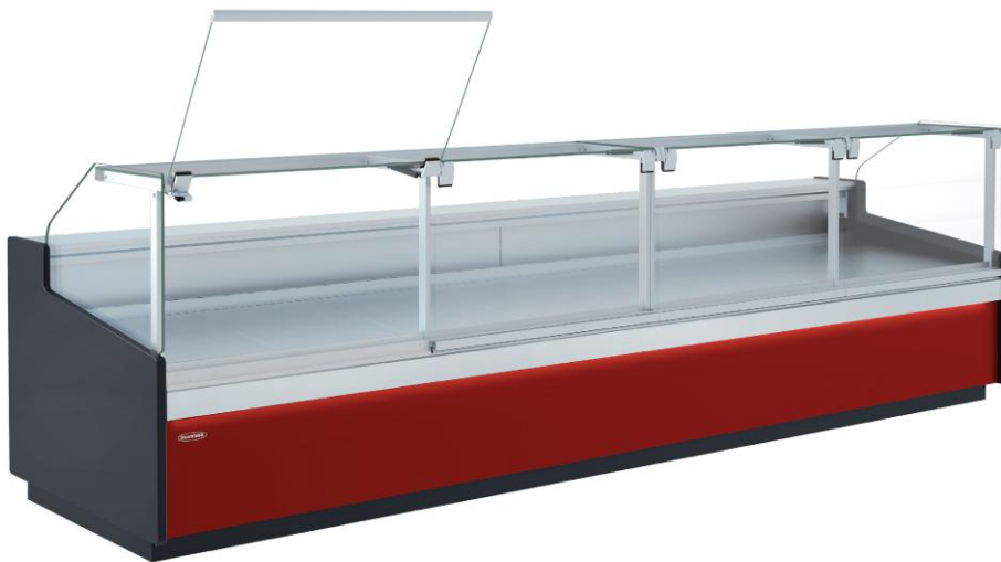
LINEAL CVE-10E-20-RC-TF + CVE-10E-20-RC-TF