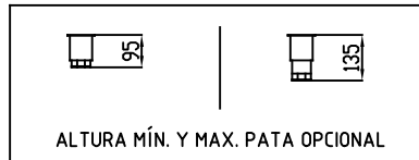
ALTURA MÍN. Y MAX. PATA OPCIONAL