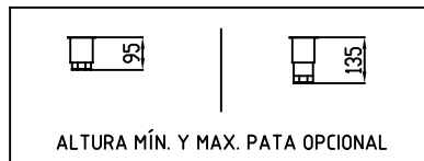
ALTURA MÍN. Y MAX. PATA OPCIONAL