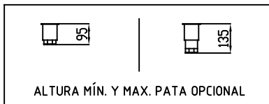
ALTURA MÍN. Y MAX. PATA OPCIONAL