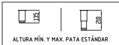
ALTURA MÍN. Y MAX. PATA ESTÁNDAR