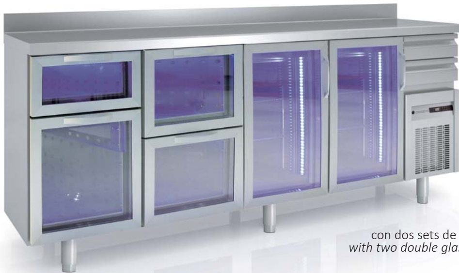
FMRV-250 con dos sets de cajones dobles with two double glass drawers sets