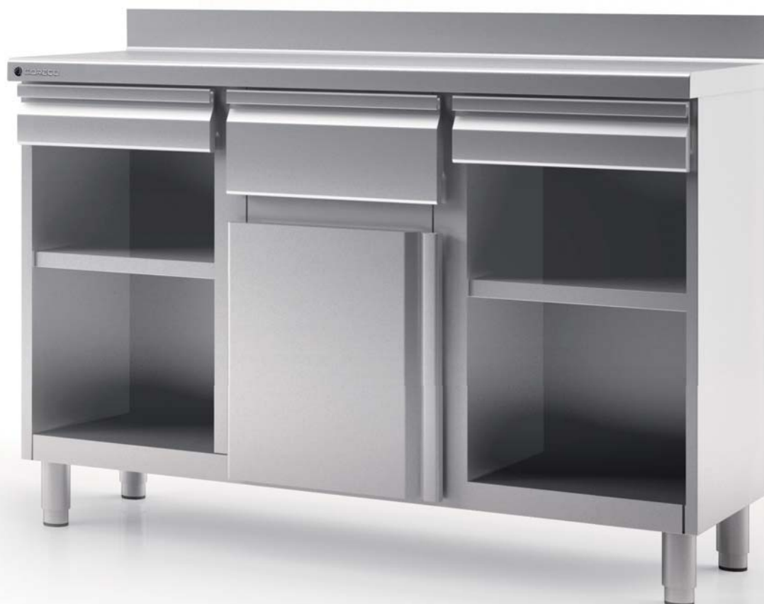
MC - 150

all photos must be considered as a reference - fotografías no contractuales