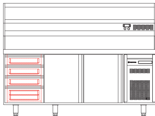
contenedores MFP80 containers