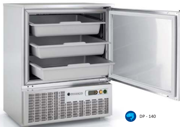
ECE - 140