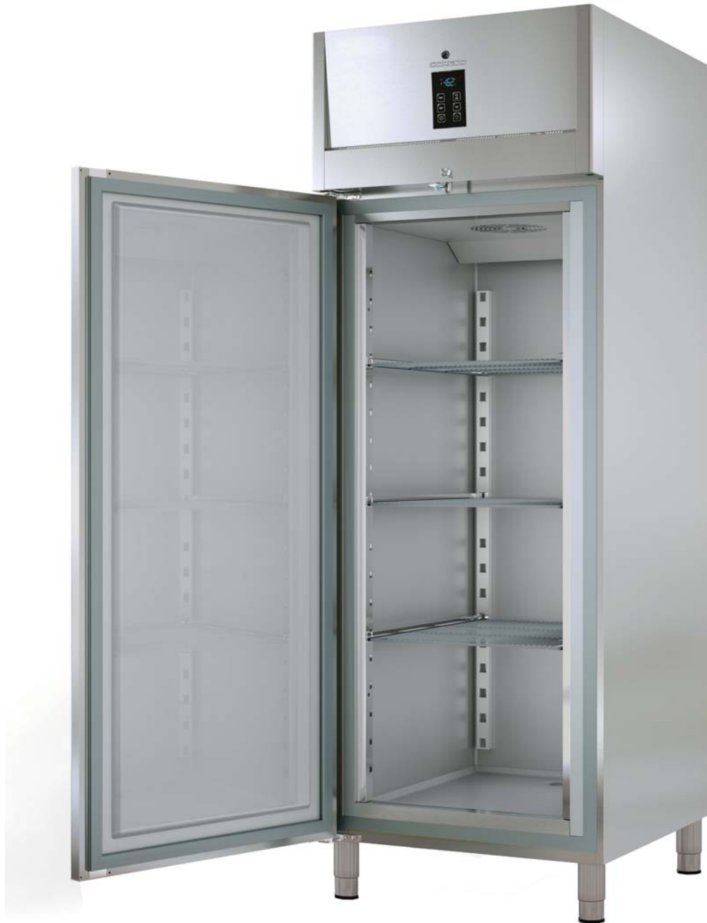
Electrónica avanzada High technology electronic system