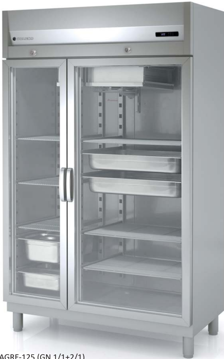
AGRE-125 (GN 1/1+2/1)

all photos must be considered as a reference - fotografías no contractuales