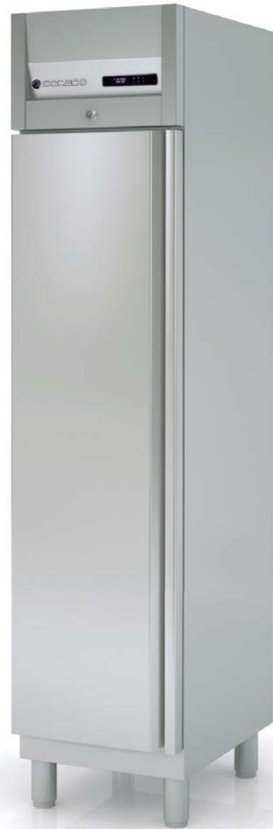
AGR-50 (GN 1/1)