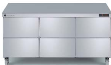
SD-72 con cajoneras opcionales with optional drawers sets

Puertas con doble bisagra Double hinged doors