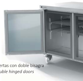
Puertas con doble bisagra Double hinged doors