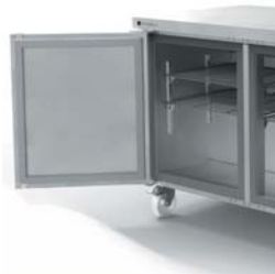
Puertas con doble bisagra Double hinged doors