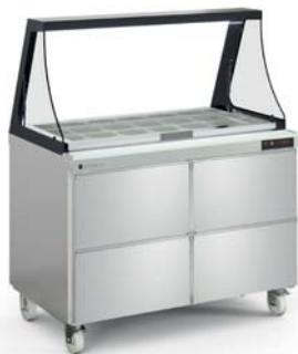
SDTP-48-18-LGL con cajonera opcional with optional drawer set