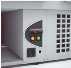
CVE-8-20-C decoración estándar standard front side finish