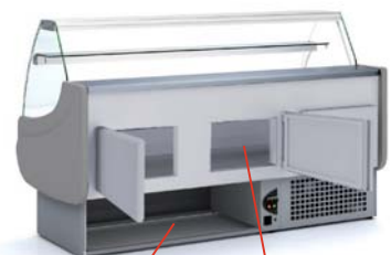
opcional interior 440x270