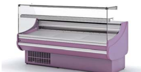
lacado total total lacquered CVE-9-20-RR