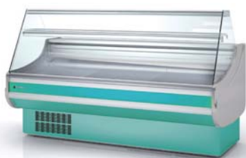
decoración frontal front decor CVE-9-20-R