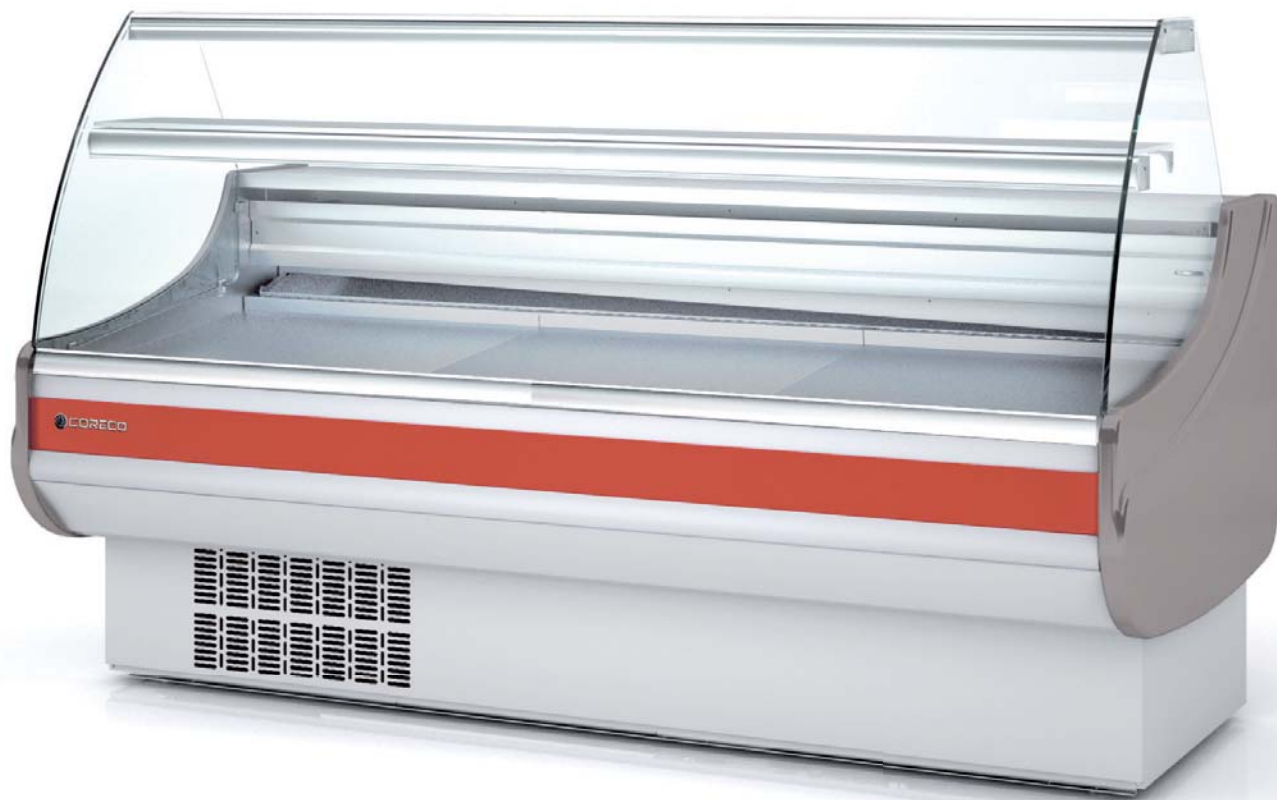
CVE-9-20-C decoración estándar standard decor