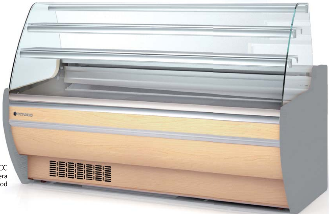
CVP-9-20-CC madera wood