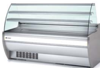
frontal decorado front decor