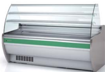
frente un color one color front decor