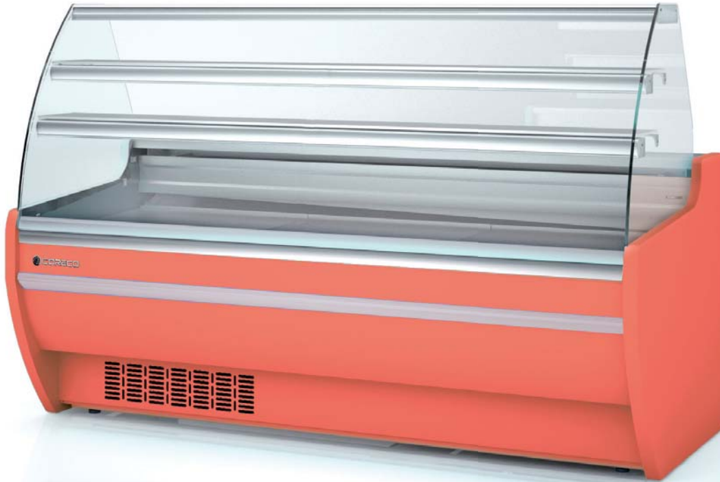
CVP-9-20-C lacado lacquered