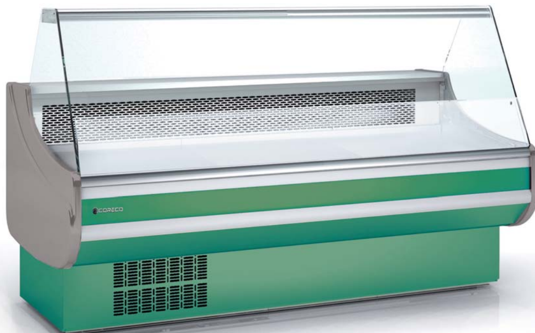
CVEE-9-20 lacado lacquered