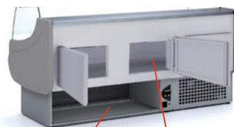
opcional interior 440x270