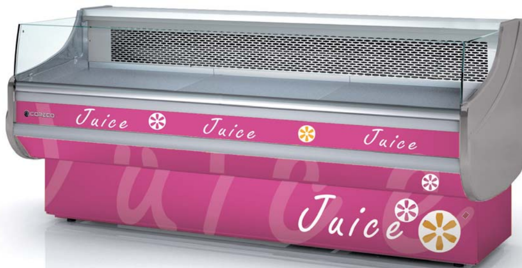
CVEA-9-20 personalizada customized