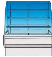
VSSB +14°C 17°C 55% HR