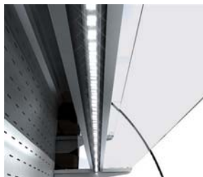
LED estantes Shelves LED lighting

all photos must be considered as a reference - fotografías no contractuales