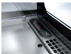
Centralita digital protegida Electronic control protected