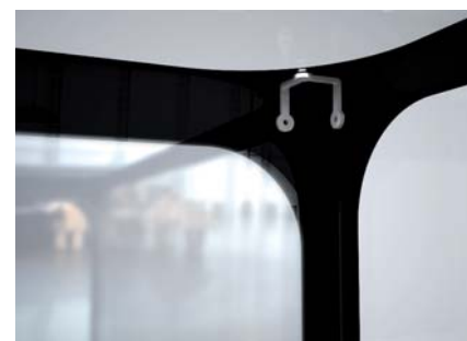
Unión cristales Glass panels join