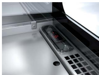
Centralita digital protegida Electronic control protected