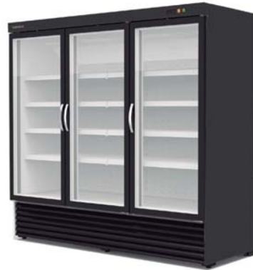
RVC-2003-NB RVC-2003-BB CVC-2003-NB CVC-2003-BB