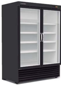
RVC-1002-NB RVC-1002-BB CVC-1002-NB CVC-1002-BB