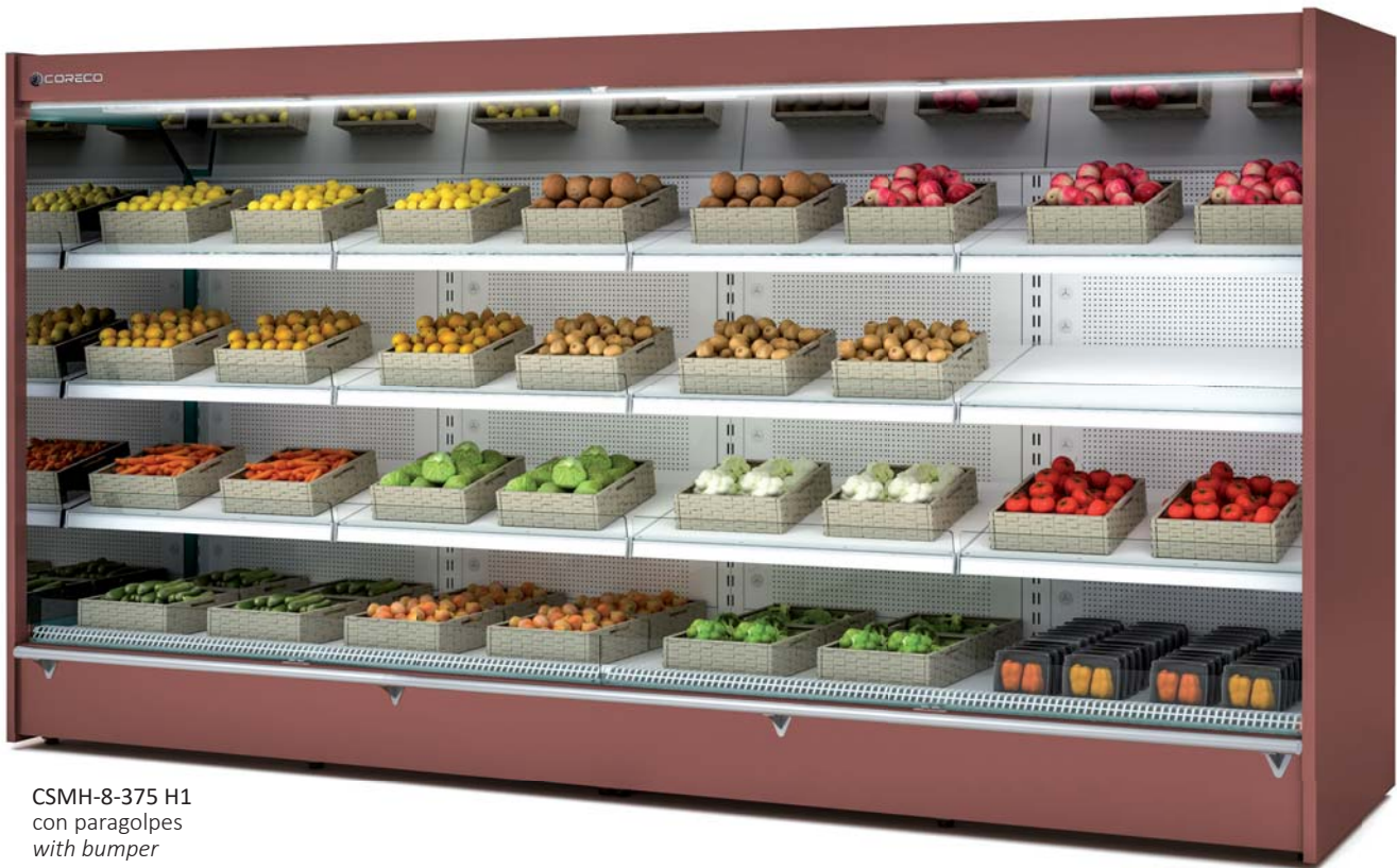
CSMH-8-375 H1 con paragolpes with bumper